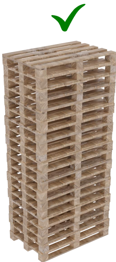
Rysunek 1. Palety w słupku w ilości 20 szt. układane jedna na drugiej „w kanapkę”

21. W/w zasady obrotu paletami obowiązują od 15.03.2024 r