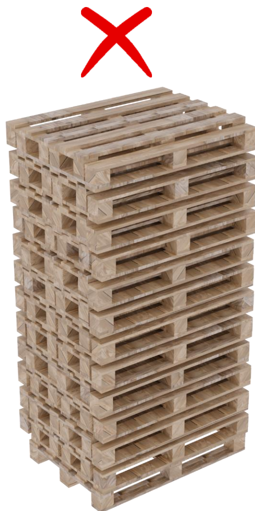
Rysunek 2. Palety w słupku ułożone jedna w drugą „na zakładkę”